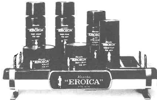
紳士用化粧品エロイカシリーズ

エロイカのあの独特の清涼感とまろやかさ、 心にゆとりを生む気品ある香り。英雄は英雄 を知るとか。エロイカは、あたくのサウナに 一級のお客さまを呼ぶでしょう。